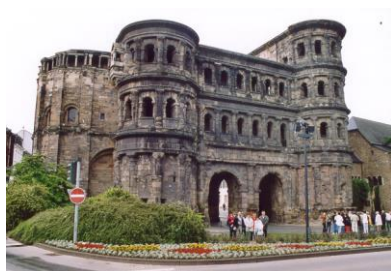
La Porta Nigra

divenne diocesi e i suoi arcivescovi figurarono tra i sette grandi elettori del Sacro romano impero. Il palazzo degli arcivescovi di Treviri, di stile rococo' è stato armoniosamente e simbolicamente edificato accanto all'Aula palatina e l'insieme forma una complesso architettonico imponente, curioso, grazioso, poetico. Treviri è la più antica città tedesca. Merita di essere notata l'onnipresenza del ricordo dei Romani tramandato non solo a Treviri ma lungo tutta la Mosella. Ovunque si potrà trovare una römerstrasse o qualche römerkeller (la cultura del vino associata alla presenza romana è estremamente viva). Questo può anche spiegare una sensibilità italiana che si è potuta constatare attraverso i nomi italiani di parecchi negozi e ristoranti.