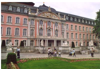
Il Palazzo degli Arcivescovi