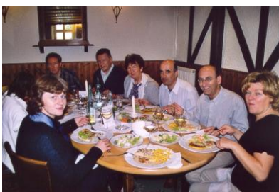
La gioia di ritrovarci