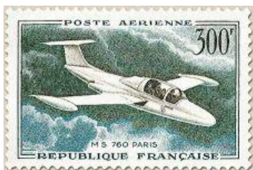
Morane Saulnier 760 I-SNAP della flotta privata dell'Eni

Ma certamente la mafia ha agito per ordine di qualcuno. Questo qualcuno resta ancora sconosciuto e le ipotesi sui possibili responsabili numerosissime : Le sette sorelle che temevano « l'autonomia energetica » dell'Italia ?