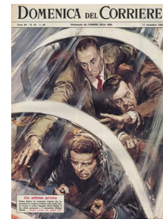
Mattei - L'aereo precipita - Domenica del Corriere

Negli anni Settanta il regista Francesco Rosi gira il film « Il caso Mattei ». Per analizzare i fatti chiede aiuto a un giornalista che si chiama Mauro de Mauro . Il giornalista fa le sue indagini e improvvisamente scompare, certamente ucciso dalla mafia. C'è relazione fra la morte di De Mauro e il caso Mattei?