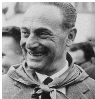
Enrico Mattei ad un raduno di partigiani

Mattei capisce che il futuro dell'Italia è nella sua autonomia nella produzione di energia.