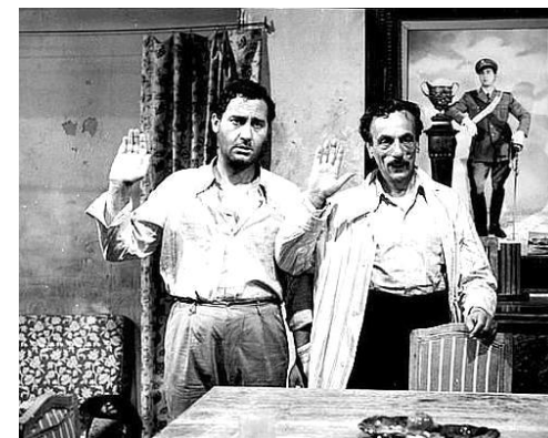
Tutti a casa (1960)

Sulla scia di Poveri ma belli realizza Mogli pericolose (1958) con la coppia Koscina-Salvatori . Nel 1960 dirige nuovamente Sordi in quello che è generalmente considerato il suo capolavoro, Tutti a casa , tragicommedia sull'Italia del dopo 8 settembre. Sul tema della Resistenza realizza anche La ragazza di Bube (1963), con la Cardinale tratto dall'omonimo romanzo di Carlo Cassola , cui segue il drammatico Incompreso