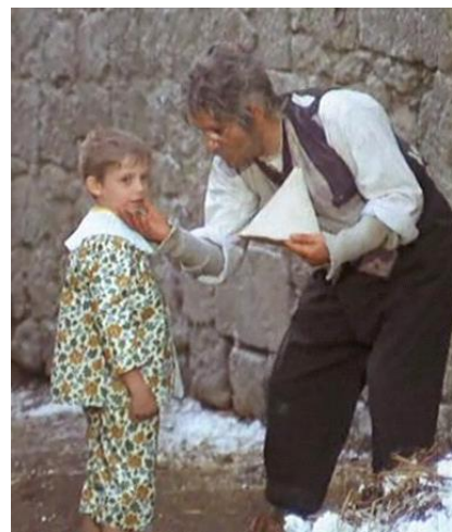
Le avventure di Pinocchio (1972)

(1966) e Infanzia, vocazione e prime esperienze di Giacomo Casanova, veneziano (1969). Firma anche un capitolo, il quinto, della saga di Don Camillo : Il Compagno Don Camillo (1965, con Gino Cervi e Fernandel ).