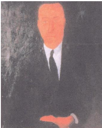
Carlo Levi "L'esploratore", 1919