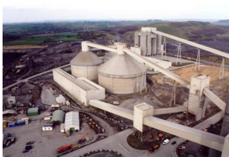
Accanto alla cava dove è estratto il calcare, i sili di Clinker, materia prima per la fabbricazione del cemento