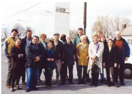
Un ricordo fotografico della recente visita alla CCB (Italcementi).