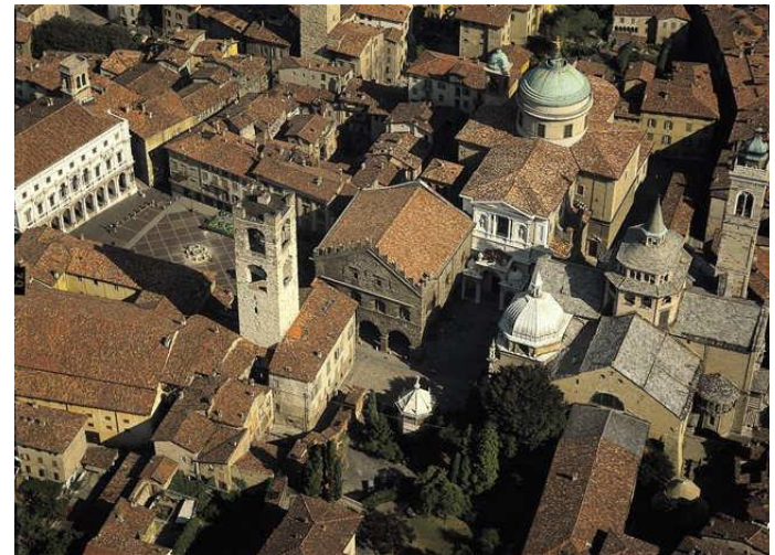
Una veduta di Bergamo (Lombardia)