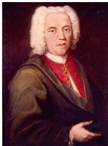
Giovanni Maria Farina 1685-1766

Con straordinario intuito commerciale il giovane Farina seppe imporre ai massimi livelli di diffusione il prodotto del Feminis applicandogli il marchio " Aqua admirabilis - Eau admirable de Cologne " e fondando la Casa produttrice " Johann Maria Farina Gegenüber dem Jülichs - Platz ". Senza l'intraprendenza e la genialità imprenditoriale del Farina l'Acqua di Colonia sarebbe molto probabilmente finita nel dimenticatoio e con essa la memoria del suo inventore.