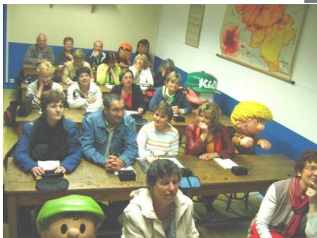
In visita al "Pays des Génies"