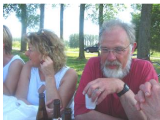
Dopo lo sforzo, la merenda