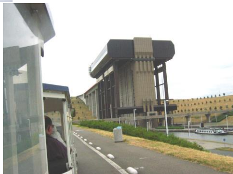
L'ascensore funicolare moderno