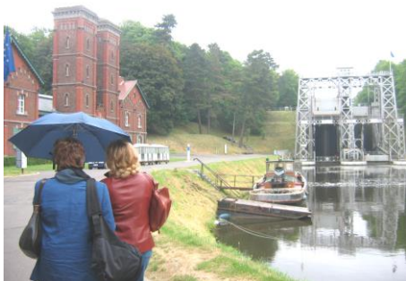
L'ascensore n° 3 del canale antico