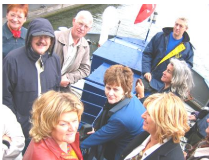
Ascoltiamo attentamente la nostra bravissima guida