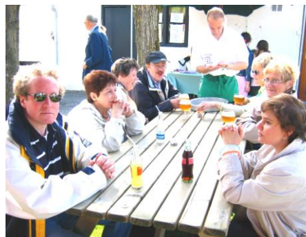
Rinfresco alla "Cantine des Italiens"