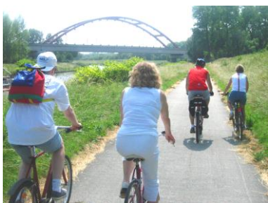
La pedalata lungo il fiume Schelda