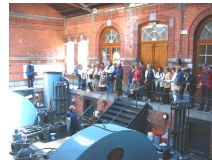
La sala macchine dell'ascensore n°3